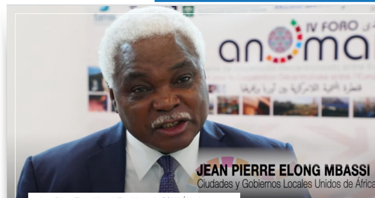
JEAN PIERRE ELONG MBASSI Ciudades y Gobiernos Locales Unidos de África

Sobre el rol de la cooperación municipal o descentralizada y su papel en África, Jean Pierre Elong Mbassi , presidente de CGLU-África, hacía la siguiente reflexión: “Frente al triunfo de la globalización existe un repliegue de los países, un paso atrás, en torno a la cooperación internacional dada por una creciente desconfianza. Las colectividades locales afortunadamente continúan promoviendo las relaciones entre los