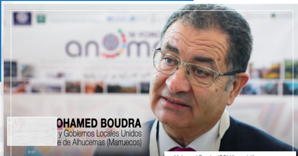
MOHAMED BOUDRA y Gobiernos Locales Unidos de Alhucemas (Marruecos)

La solidaridad, cooperación, liderazgo y compromiso de los gobiernos locales cobra más relevancia en el contexto de la Agenda 2030 y la localización de los Objetivos de Desarrollo Sostenible (ODS). Para ello resulta fundamental la dotación de recursos, competencias y mayor cooperación internacional para aprender y compartir experiencias de localización exitosas. Así lo expresó Mohammed Boudra , presidente de Ciudades y Gobiernos Locales Unidos (CGLU), alcalde de Alhucemas, miembro de ANMAR, que señaló la importancia de la RED ANMAR y de las alianzas mundiales para la consecución de los Objetivos de Desarrollo Sostenible aseverando que “ANMAR juega un papel de puente entre Andalucía y Marruecos, y Europa y África en el ámbito de las autoridades locales” .