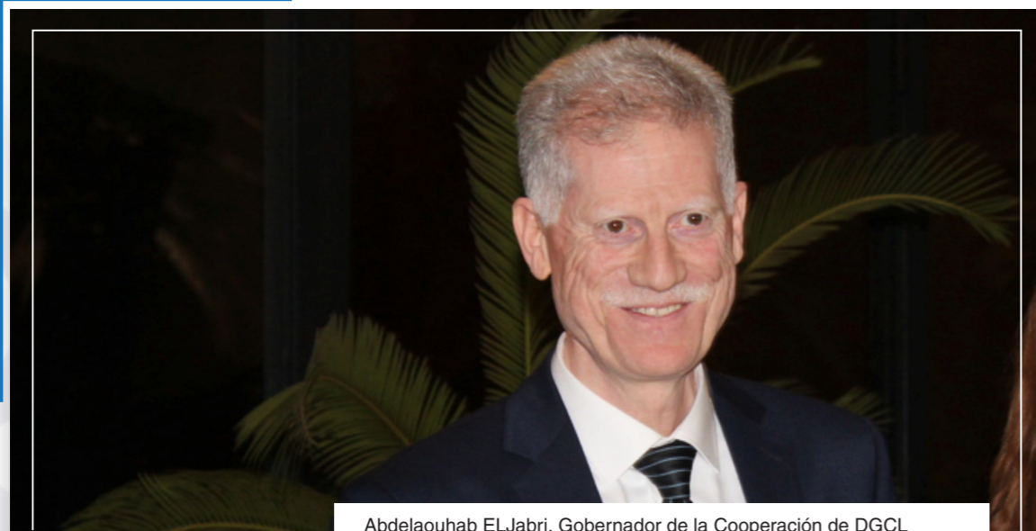
Abdelaouhab ELJabri, Gobernador de la Cooperación de DGCL

La solidaridad, cooperación, liderazgo y compromiso de los gobiernos locales cobra más relevancia en el contexto de la Agenda 2030 y la localización de los Objetivos de Desarrollo Sostenible (ODS). Para ello resulta fundamental la dotación de recursos, competencias y mayor cooperación internacional para aprender y compartir experiencias de localización exitosas. Así lo expresó Mohammed Boudra , presidente de Ciudades y Gobiernos Locales Unidos (CGLU), alcalde de Alhucemas, miembro de ANMAR, que señaló la importancia de la RED ANMAR y de las alianzas mundiales para la consecución de los Objetivos de Desarrollo Sostenible aseverando que “ANMAR juega un papel de puente entre Andalucía y Marruecos, y Europa y África en el ámbito de las autoridades locales” .