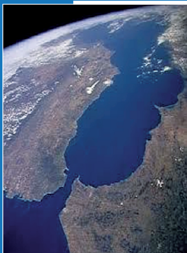
Vista aérea del estrecho de Gibraltar

P ara enmarcar el Foro AN-MAR en esta y en sus ediciones anteriores, hay que conocer el Programa AN^MAR, que comenzó en enero del 2006 como una iniciativa estratégica del Fondo Andaluz de Municipios para la Solidaridad Internacional, cuyo objetivo era estructurar y normalizar toda la cooperación municipal andaluza con Marruecos, creando una Red de municipios y territorios para trabajar conjuntamente en el marco de la cooperación descentralizada, ha pasado a convertirse, en la Federación AN^MAR: una estructura municipal transfronteriza compuesta por más de 60 municipios, agrupaciones o asociaciones de gobiernos locales y otras entidades socias de ambas regiones como instrumento transnacional para la cooperación territorial.