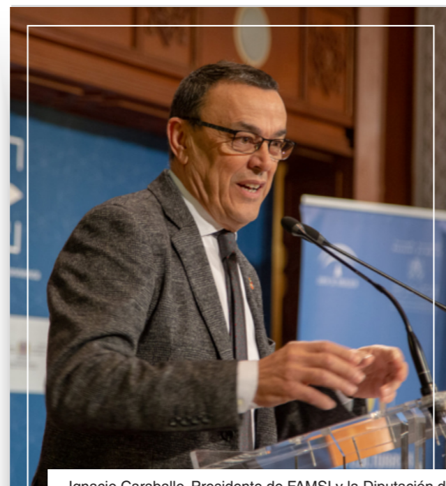
Ignacio Caraballo. Presidente de FAMSI y la Diputación de Huelva

Y en esta visión compartida, este reto desde los gobiernos locales y la ciudadanía para impulsar políticas en nuestros territorios más sostenibles la traslada el presidente del Fondo andaluz de municipios para la solidaridad internacional (FAMSI), Ignacio Caraballo , quien concluye: Andalucía y sus ayuntamientos están en FAMSI y "FAMSI es la cara generosa del pueblo andaluz, somos responsables y representantes de nuestros vecinos y vecinas, y por tanto, somos su rostro solidario"