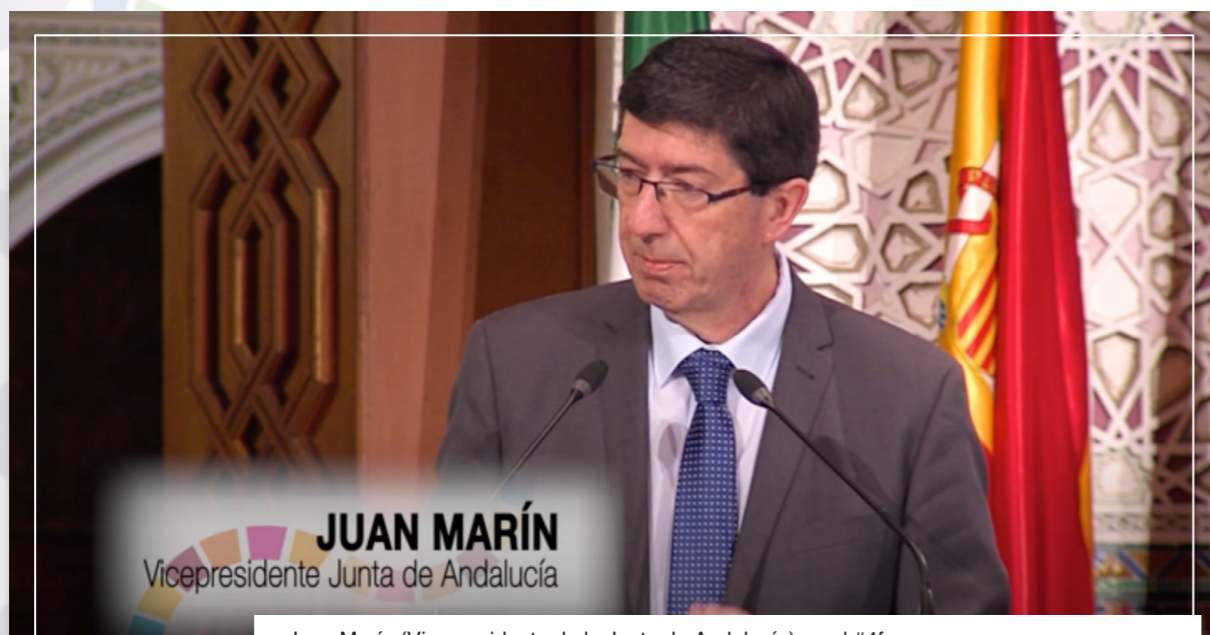
Juan Marín (Vicepresidente de la Junta de Andalucía) en el #4foroanmar

Esta edición contó además con numerosos participantes africanos y europeos del ámbito local que han enriquecido los debates y talleres y alimentado esta cooperación entre territorios de base municipal. Una edición que ha despertado el interés de ayuntamientos europeos y del África Subsahariana con diez países representados; redes municipales, fondos autonómicos de cooperación nacionales, redes europeas de ciudades y agencias de naciones unidas.