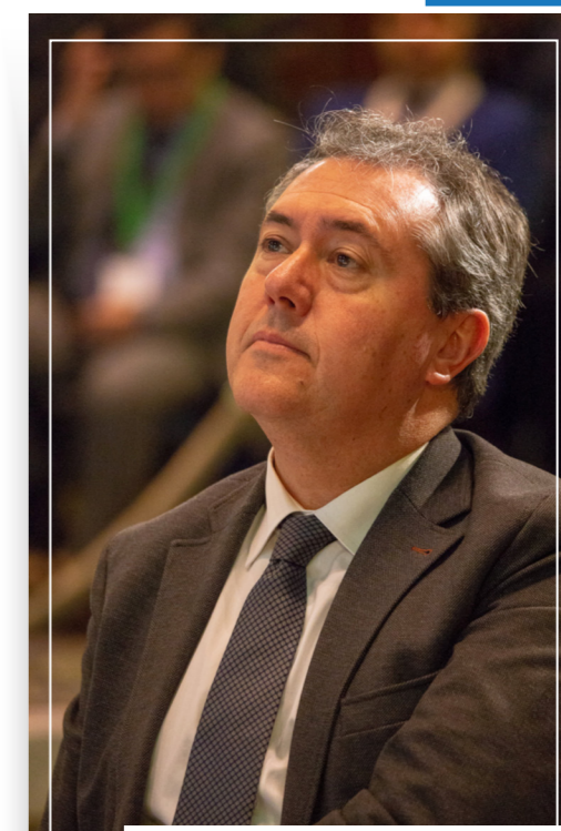
Juan Espadas, Maire de Séville

Cette vision explique que le IV Forum ait voulu transférer cette expérience de plus de 20 ans de coopération entre villes vers d'autres territoires: l'Europe et l'Afrique sub-saharienne; Abdelouhab Eljabri , Gouverneur pour la coopération de la Direction générale des collectivités locales du ministère de l'Intérieur, l'a déclaré lors de la signature de la Convention -Cadre qui transmettra cette coopération triangulaire au niveau municipal, et où l'expérience d'ANMAR est assurément extrapolable à des pays comme La Côte d'Ivoire, la Mauritanie, le Bénin, le Sénégal ou la Tunisie.