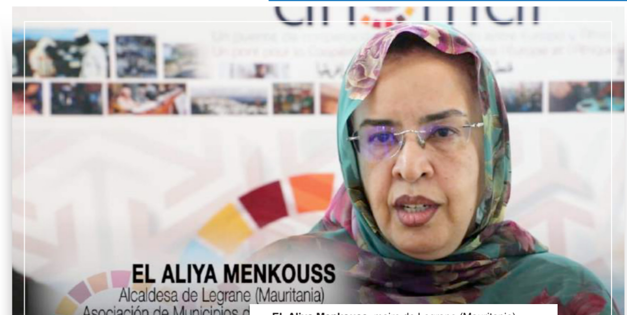
EL ALIYA MENKOUSS Alcaldesa de Legrane (Mauritania) Asociación de Municipios d

Une idée qu' EL Aliya Menkouss de l'Association des municipalités mauritaniennes souligne, dans sa volonté d'établir une coopération Sud-Sud entre le Maroc et la Mauritanie ainsi que de mettre en œuvre des actions avec nos voisins du sud et avec l'Andalousie, dans un format de coopération triangulaire.