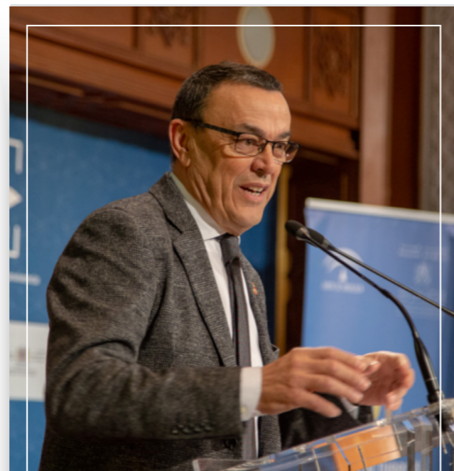
Ignacio Caraballo. Presidente de FAMSI y la Diputación de Huelva

Et dans cette vision partagée, ce défi depuis les gouvernements locaux et de la citoyenneté pour promouvoir les politiques dans nos territoires les plus durables, est celle transmise par le président du Fonds andalou des municipalités pour la solidarité internationale (FAMSI) de 2013 à décembre 2020 et de la Députation Provinciale de Huelva jusqu'à fin 2020, Ignacio Caraballo , qui conclut: l'Andalousie et ses municipalités sont regroupées au sein du FAMSI et « FAMSI est le visage généreux du peuple andalou, nous sommes responsables et représentants de nos voisins et voisines, et par conséquent, nous sommes leur visage solidaire ».