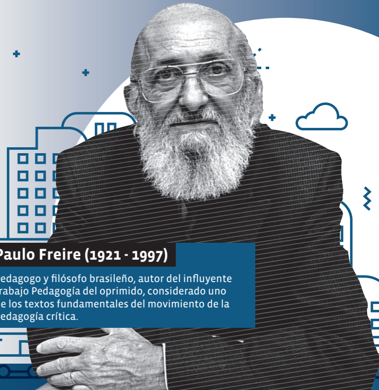
Paulo Freire (1921 - 1997)

“La educación no cambia al mundo: cambia a las personas que van a cambiar el mundo”.